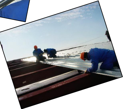
«ՏԵԽՇԻՆ» ՍՊԸ 2015թ.